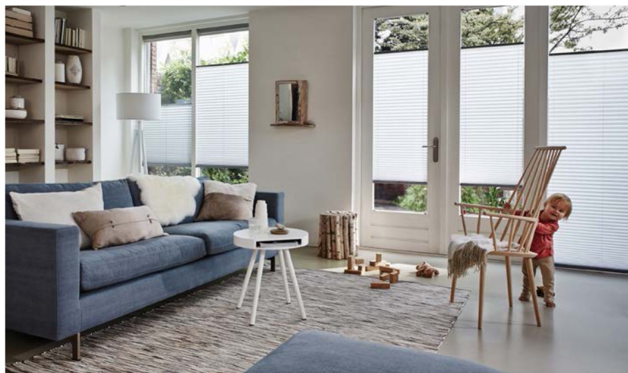
Plisségardiner der kører begge veje, kan fås i flere forskellige modeller med enten enkelt stof eller dobbelt stof (dobbelt stof kalder man også duette stof).