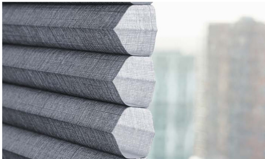
Duettestof isolerer bedre end enkelt stof. Der er ingen synlige huller ned gennem stoffet og så er det mere effektivt mod solens stråler.